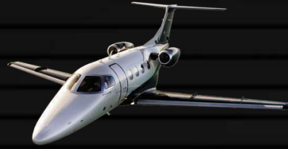
Embraer Phenom 100